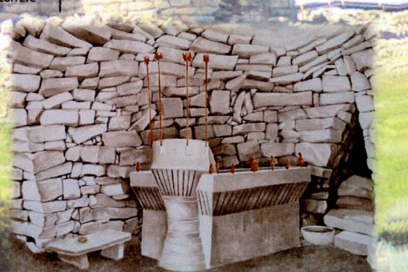
Ricostruzione ipotetica dell'altare

bronzo e oro. La celebrazione dei rituali avveniva in occasione di ben definite scadenze del calendario agrario, la più importante delle quali sarebbe da porsi in corrispondenza con il solstizio d'estate (21 Giugno). La fine dell'anno agrario imponeva, infatti, adeguate cerimonie di ringraziamento e gli indispensabili auspici per propiziare, dopo la crisi estiva, il buon esito del nuovo ciclo.