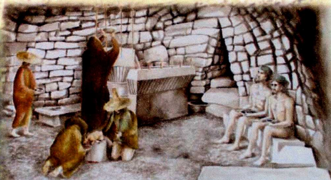
Ricostruzione ipotetica di un rito

Realizzato nel corso dell'età del Bronzo (XIV secolo a.C.) nel livello inferiore del bastione trilobato della fortezza nuragica di Su Mulinu, il vano e ha pianta ellittica, con copertura a carena di nave rovescia costituita da blocchi in calcare di medie e piccole dimensioni, chiusa, in origine, da grosse lastre oggi mancanti. Sin dalle origini l'ambiente venne destinato alla celebrazione di culti religiosi, testimoniati dalla costante presenza al suo interno di almeno due focolari rituali: il primo, decentrato, per la bruciatura di sostanze oleose, il secondo, centrale, funzionale al sacrificio di giovani animali, per lo più suini, ma anche ovini e bovini. Dopo un periodo di abbandono, tra il XIII e l'XI secolo a.C., la ripresa del culto nuragico comportò la realizzazione all'interno del vano di un bancone-sedile, di due fosse sacrificali e la posa in opera di un monumentale altare in pietra. Il nuraghe, infatti, venuta meno l'originaria e prevalente funzione difensiva, nel corso della prima età del Ferro (IX-VIII secolo a.C.) diventa un importante centro culturale e religioso.